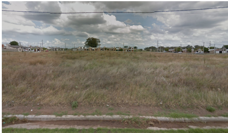
Vista desde Calle Maldonado