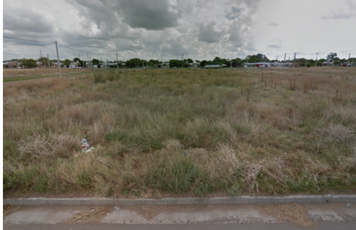
Vista desde Calle Marconi